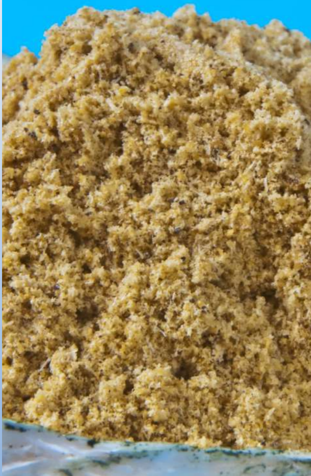
Polvere di Cozza Verde